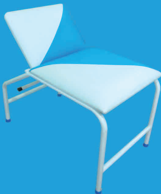
TABLE D'EXAMEN PÉDIATRIQUE DEPM02