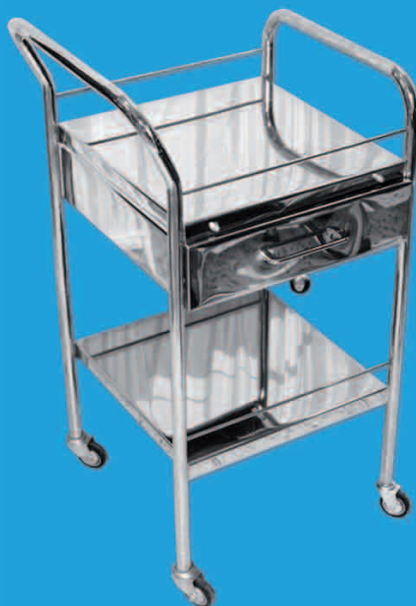
TABLE DE CHEVET EN INOX AVEC UN TIROIR TBCH1TM