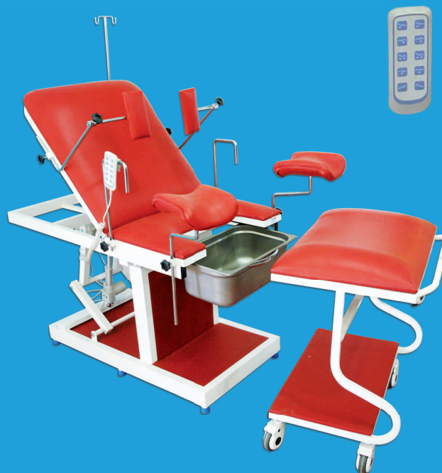
TABLE D'ACCOUCHEMENT ÉLECTRIQUE