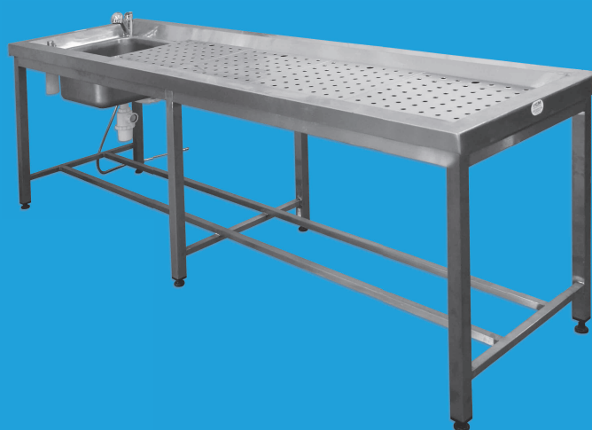
TABLE D'AUTOPSIE RECTANGULAIRE AVEC ÉVIER ET SUPPORTS DECORPS