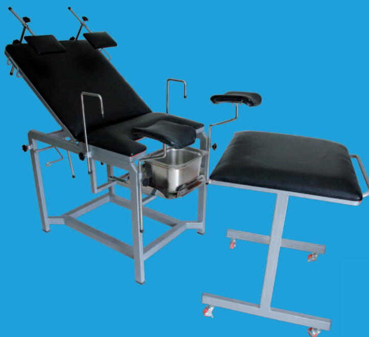
TABLE D'ACCOUCHEMENT AVEC CHARIOT PORTE BÉBÉ TBACHM2