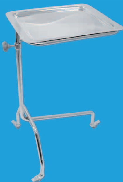
TABLE DE MAYO TMGMM