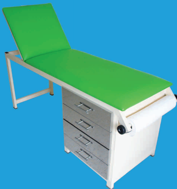
TABLE D'EXAMEN AVEC QUATRE (4) TIROIRS DCSEMT