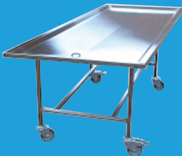
TABLE D'AUTOPSIE TDPSM