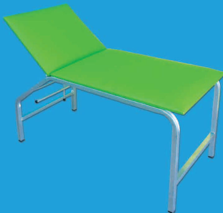
TABLE D'EXAMEN PÉDIATRIQUE DEPM01