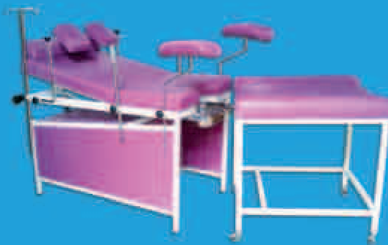
TABLE D'ACCOUCHEMENT TBACCHM1