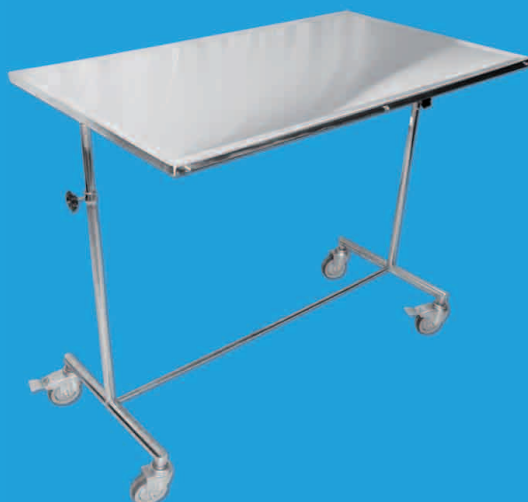
TABLE DE MAYO GM TMHVGMM