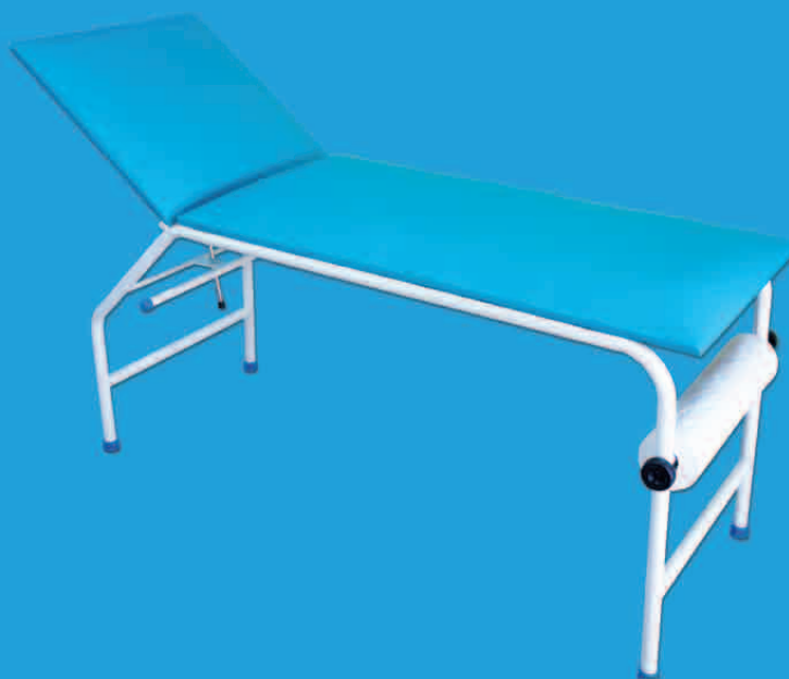
TABLE D'EXAMEN AVEC PORTE ROULEAU DCPO1M