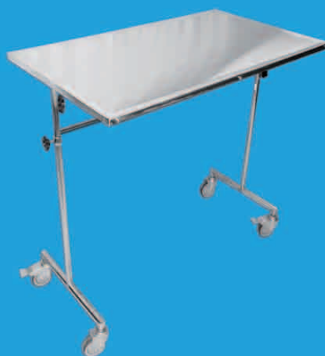
TABLE DE MAYO MM TMHYM