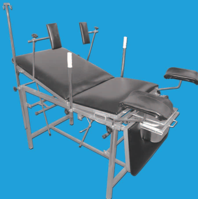
TABLE D'ACCOUCHEMENT TBACM